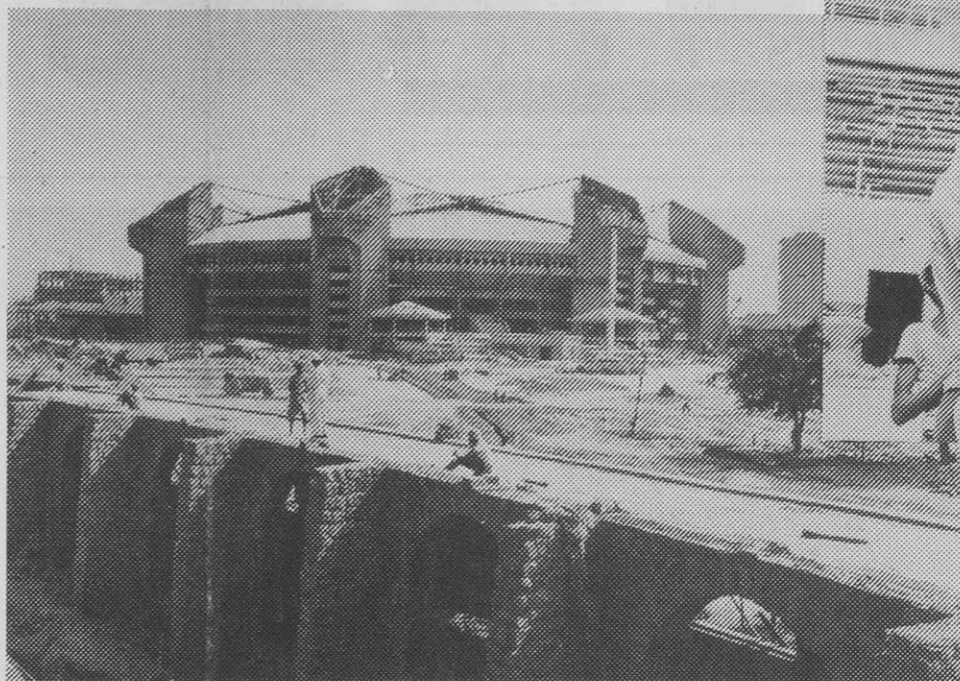
Het Indraprastha Stadion

bewind was gekomen, werden alle zeilen bijgezet om de bouw van zes nieuwe en de renovatie van elf oude stadions en sporthallen op tijd af te krijgen. Het was toen januari 1981, en er waren nog maar achttien maanden te gaan. Nu verkeert met name Delhi al in een zekere roes. Iedereen en alles refereert aan de Spelen. Hotelmanagers wrijven zich in de handen, ministers maken zich druk, en reclameborden worden in stijl gebracht, zoals die van Air India, de 'officiële carrier' voor de negende Asiad . Air India's buigende Maharadja in de rode jas staat in de startblokken, zij aan zij met het olifantje Appu (de Mascotte voor de Spelen - een soort speelgoed-Ganesj): Ready to go!