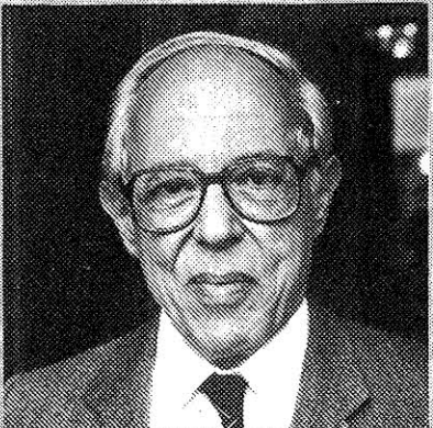
EINSTEIN-BIOGRAAF ABRAHAM PAIS