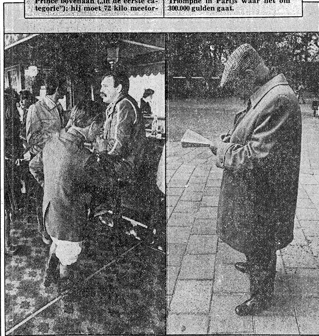
DE WERELD VAN HET PAARDENRENNEN

sen. Onderaan staat (vierde categorie) het paard Seven Miles , met 40 kilo, een beklagenswaardig klein jockeytje. Voor de race begint, worden de jockey's gewogen met zadel en al. Wanneer ze te licht worden bevonden gaat er een plakje lood mee onder het zadel. Alleen Engelse volbloedpaarden mogen bij de rennen worden ingeschreven, in tegenstelling tot de dravers, waar halfbloeden lopen; Schillehitten, Manegesloofjes en Belgische dikbillen worden gedis-crimineerd. Een internationaal vermaard renpaard van dit moment is de Amerikaanse Ile de Bourbon , een paard dat vijf miljoen gulden doet op de markt. Vooral Amerika, Japan, Engeland en Frankrijk zijn paardenlanden bij uitstek. De Nederlandse renpaarden worden kwalitatief wel steeds beter, maar halen het in snelheid nog niet bij hun buitenlandse neven en nichten. Ze zijn dan ook niet zo krankzinnig duur. De grootste Nederlandse ren is de jaarlijkse Grote Prijs der Nederlanden, waar het om een eerste prijs van 41.000 gulden gaat, die meestal door een buitenlands paard wordt gewonnen. De duurste race in Europa is de Prix d'Arc de Triomphe in Parijs waar het om 300.000 gulden gaat.